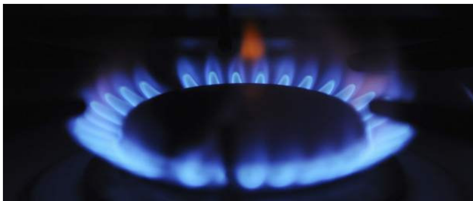
Un quemador de una cocina de gas.